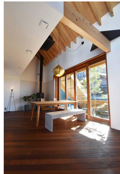
尚建工務店モデルハウス

【備考】 上水道加入者納付金37,400円、 下水道受益者負担金300,000円が別途必要